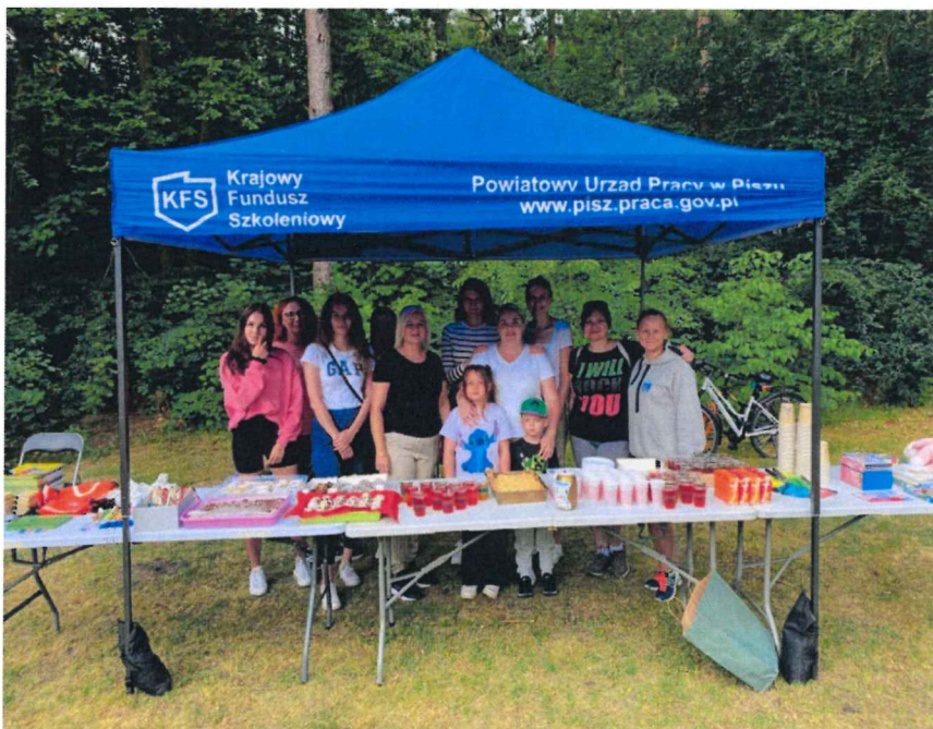
VIII KOLOROWY BIEG CHARYTATYWNY NATALIA DLA ANTOSIA