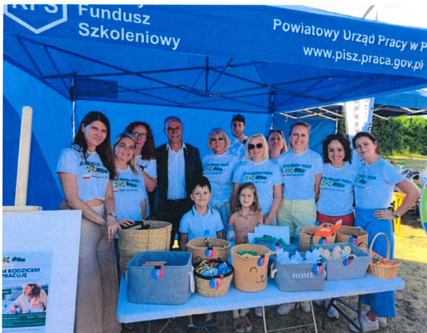
XXV WARMIŃSKO- MAZURSKIE DNI RODZINY „RAZEM TWORZYMY RODZINĘ”