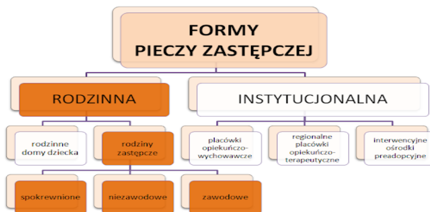
Rysunek 2. Podział pieczy zastępczej